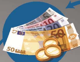
AUSGABE GELD Deutsche Bundesbank