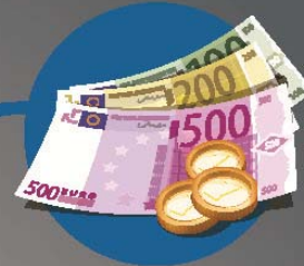
HERSTELLUNG GELD Druck der Banknoten Prägung der Münzen